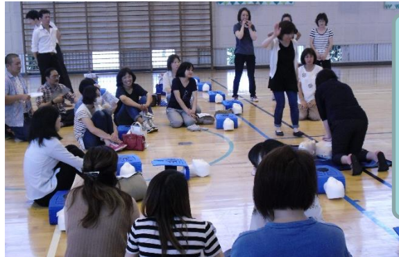
先生方も全員参加です

蕪崎市より、ニーラの連絡ノートをたくさんいただきました。低学年に3冊、高学年に2冊配付しました。ご家庭で有効にお使いください。