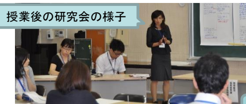
授業後の研究会の様子