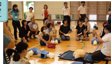
授業参観、学年部会の後、5・6年生の保護者を対象に救急法講習会がありました。みなさん真剣です。