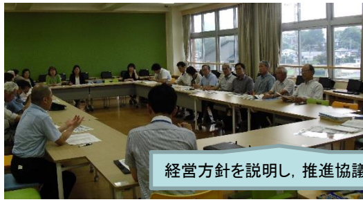
経営方針を説明し、推進協議会で意見をいただきました。

7月3日(月)に、今年度第1回目の甘利教育推進委員会を開催しました。この会議は「ふるさと甘利を愛する子ども」の育成をめざして、公民館長、民生委員、主任児童委員、老人会、交番、教育後援会、学校評議員、学校職員など甘利小学校の教育活動にかかわる地域の代表の方々に、甘利小学校の教育方針などを提案し、ご意見を伺いました。