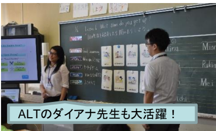
ALTのダイアナ先生も大活躍!